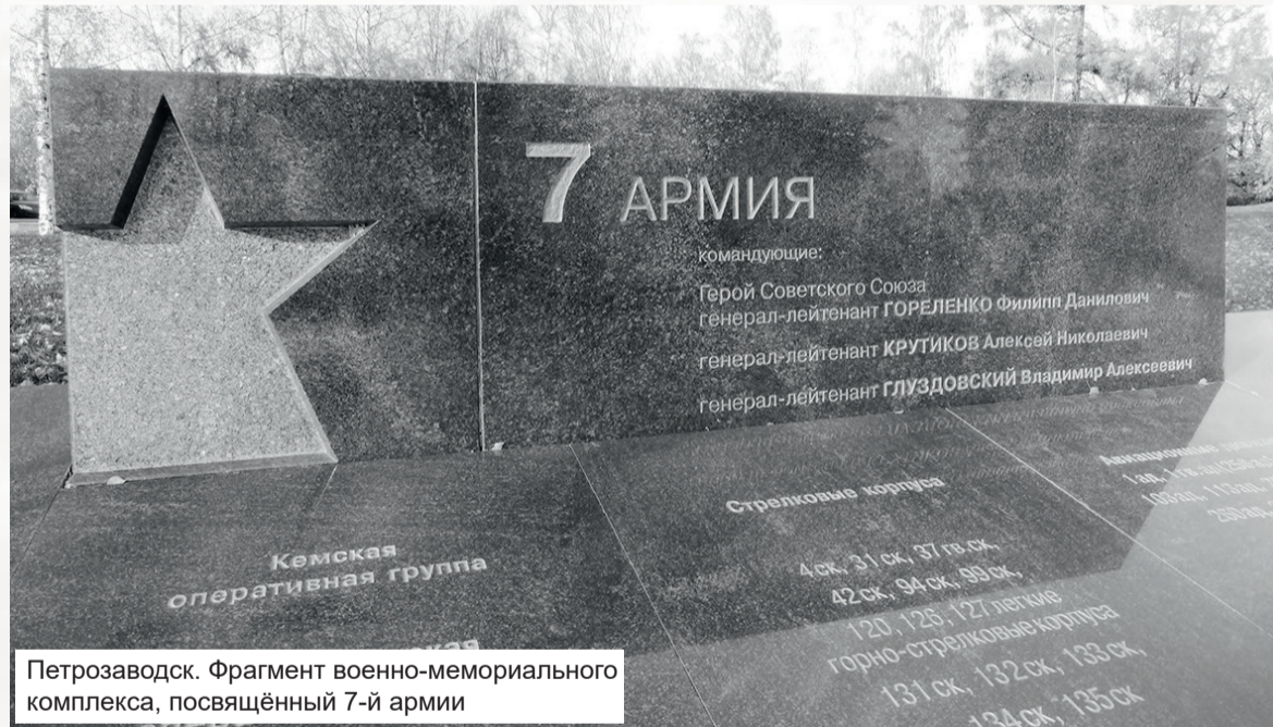
Петрозаводск. Фрагмент военно-мемориального комплекса, посвящённый 7-й армии

В оборонительных сражениях на линии Маннергейма обескровить главные силы ЛенВО на Карельском перешейке и на севере Ладоги, сковывающими действиями измотать войска РРКА на других направлениях. С подходом обещанной помощи западных союзников перенести