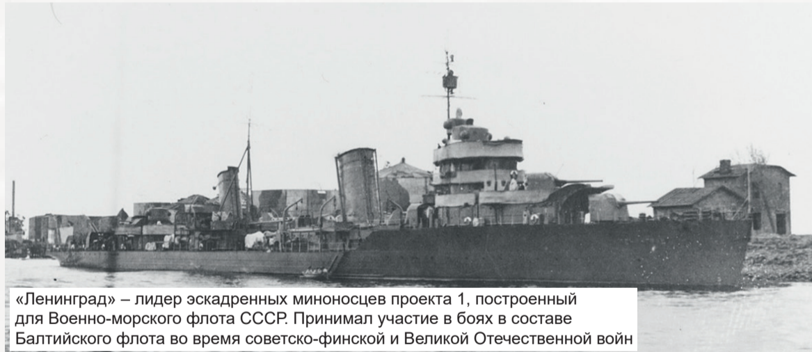
«Ленинград» – лидер эскадренных миноносцев проекта 1, построенный для Военно-морского флота СССР. Принимал участие в боях в составе Балтийского флота во время советско-финской и Великой Отечественной войн