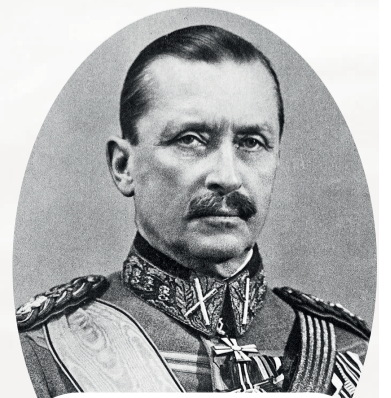
Карл Маннергейм, барон, русский и финский военный и государственный деятель шведского происхождения