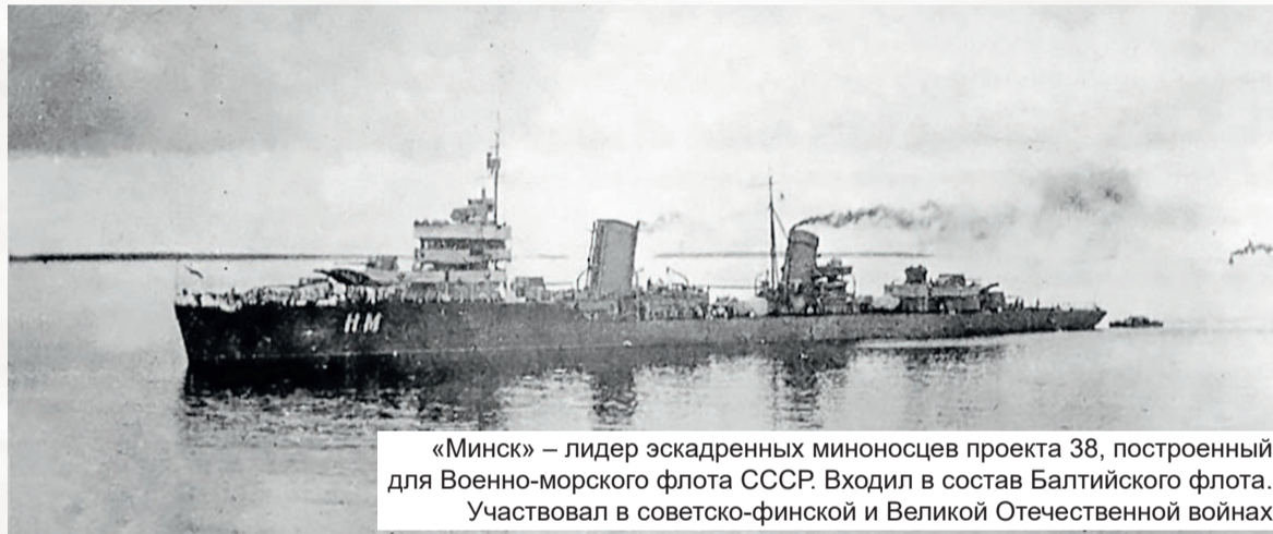
«Минск» – лидер эскадренных миноносцев проекта 38, построенный для Военно-морского флота СССР. Входил в состав Балтийского флота. Участвовал в советско-финской и Великой Отечественной войнах