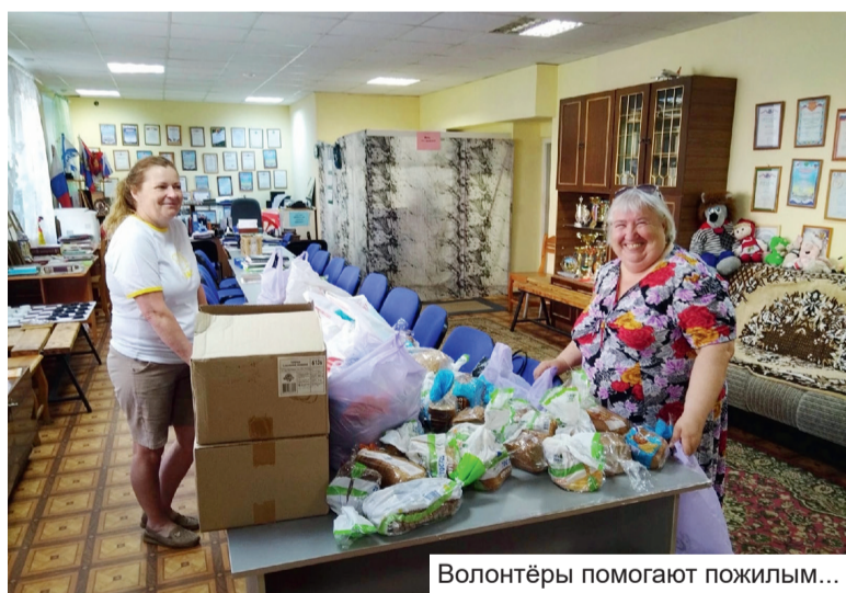
Волонтеры помогают пожилым...