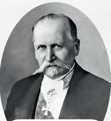
Кюёсти Каллио, политический деятель, президент Финляндии с 1937 по 1940 годы