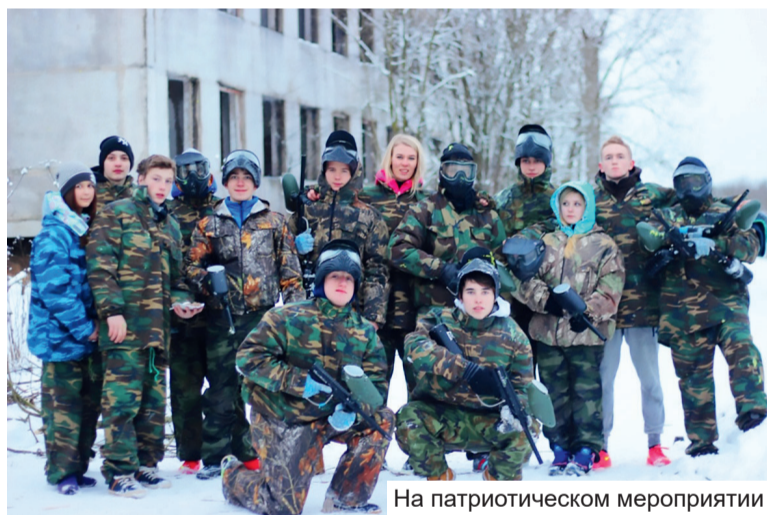
На патриотическом мероприятии